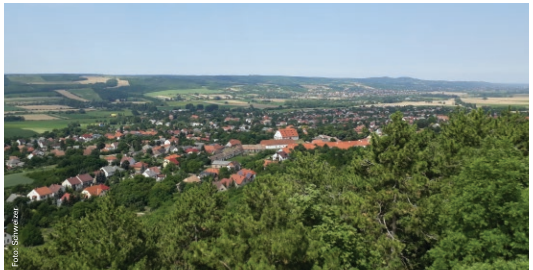
Umgebung von Győr

309 Berater*innen aus 23 europäischen Ländern trafen sich vom 17. bis 21. Juni 2018 auf der 57. IALB und 7. EUFRAS Konferenz in Ungarn, um ihre Erfahrungen mit den aktuellen Herausforderungen in der Agrarberatung durch technologischen und sozialen Wandel gemeinsam zu diskutieren.