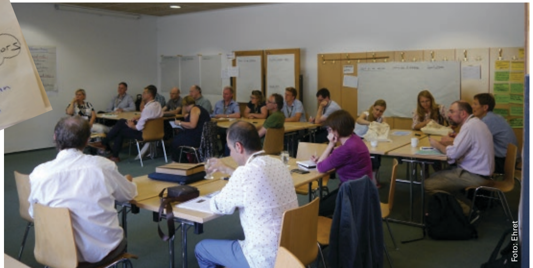
Die neue Rolle für Berater wurde im Workshop diskutiert